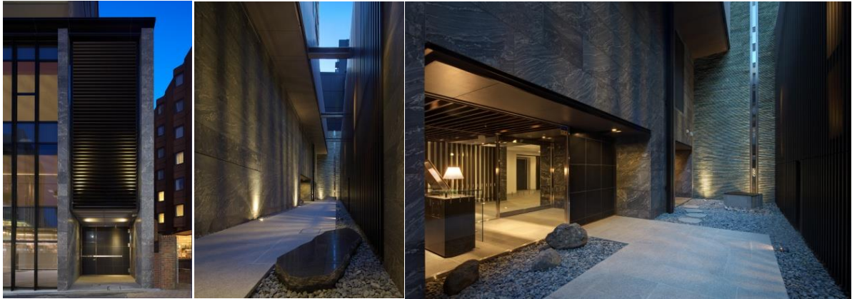
外観（住戸アプローチ）

渋谷公園通りに約 27m の間口を持つ敷地に対し、1 階既存店舗（コンビニ）の間口、1 階～3 階までのエントランスの間口、更に駐車時出入口が必要なため、4 階以上の住宅へのアプローチは 3m 程であった。計画はこの路地状のアプローチを方形乱貼の延段とし、更に 6m の垂直な空間を与え、縦格子を配する事により、周辺環境との結界した"凜"とした和らぎの空間構成を試みた。